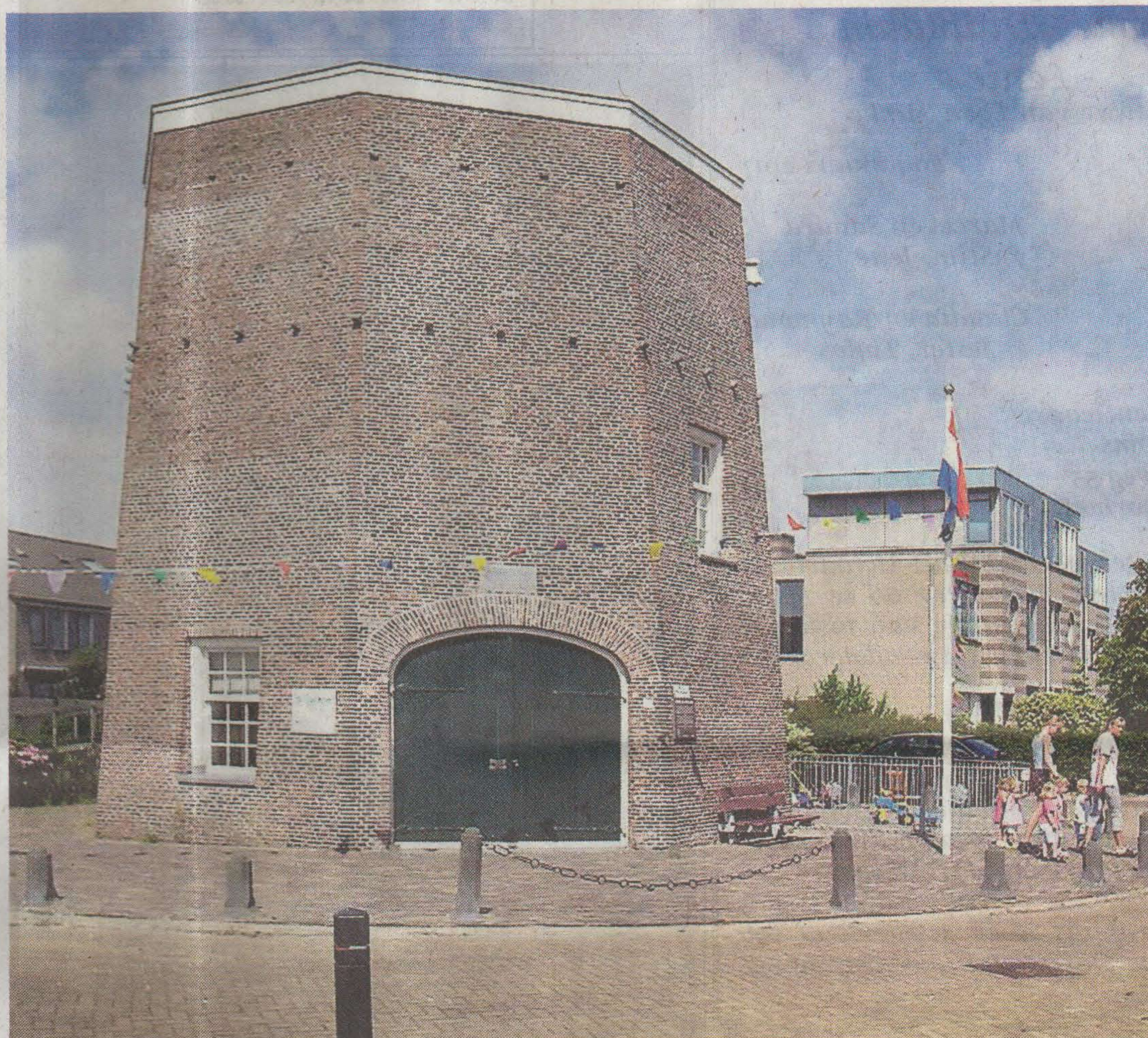
Op dit moment staat alleen de onderbouw nog.

In een rapport van bijna veertig pagina's zijn allerlei zaken onderzocht; van geluidsoverlast en veiligheid tot schaduwwerking en gevolgen voor het milieu. Niets kan de opbouw voorkomen. „Aangezien de wieken circa 12,5 meter lang zijn, de afstand van het onderste uiteinde van de wieken tot de grond circa 9,5 meter bedraagt en er een omloop zal worden gebouwd, zal er geen sprake zijn van onaanvaardbare veiligheidsrisico's”, staat in rapport. „Ook zal er gezien de geringe lengte van de wieken geen sprake zijn van onaanvaardbare geluidshinder wanneer de molen draait. Bovendien zal de molen niet 's nachts