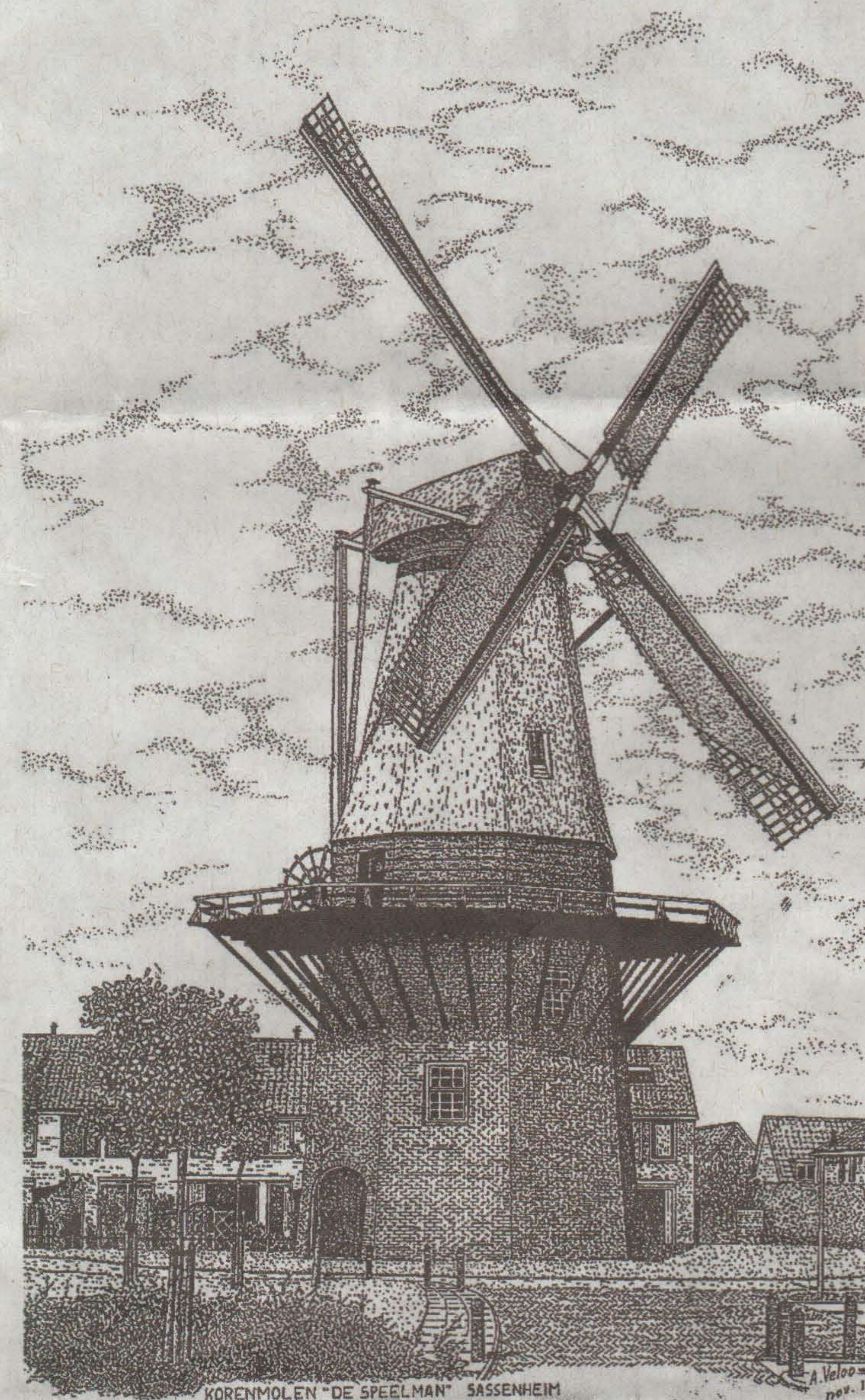
KORENMOLEN 'DE SPEELMAN' SASSENHEIM

Zo zag de molen er in de glorie-dagen uit. STICHTING DE MOLEN VAN SASSENHEIM